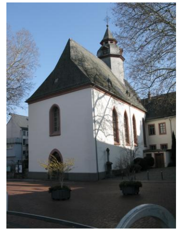
St. Anna, Limburg

14:15 Uhr Domschatz im Dommuseum Führung zu Kreuztafel und Petrusstab